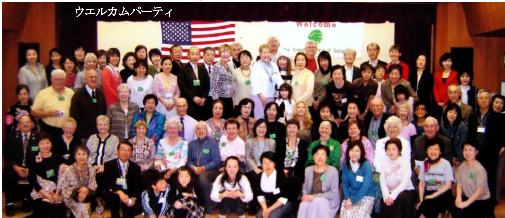
ウェルカムパーティー

桜の花が満開の時に22名のアンバサダーをお迎えすることが出来ました。4月4日から名古屋で開催されるアジアパシフィックフェスティバルにあわせての来日でした。ウェルカムパーティーでは会員との再会を喜びあい、イギリスからのゲストや会員の友人も加わりたくさんの方が参加し、丁度春休み中でしたので会員のお孫さんも一緒に楽しい時間を過ごしました。小さなホストは未来の埼玉クラブを担ってくれることでしょう。