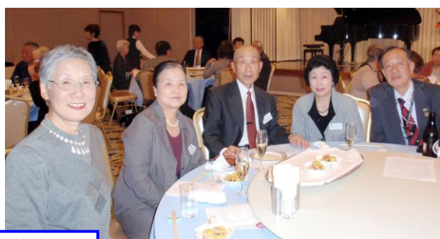
会食を楽しむ皆さん