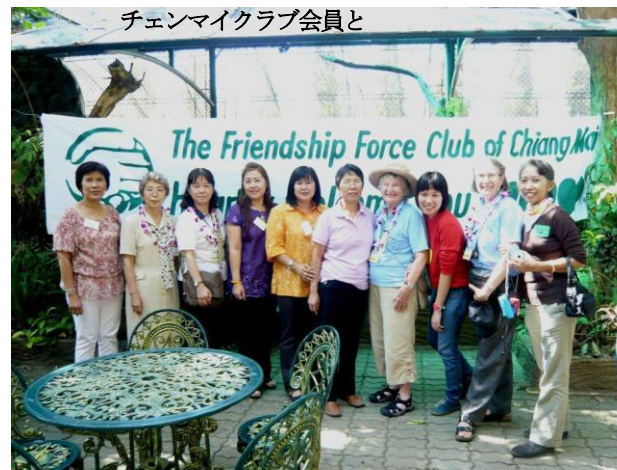
チェンマイクラブ会員と