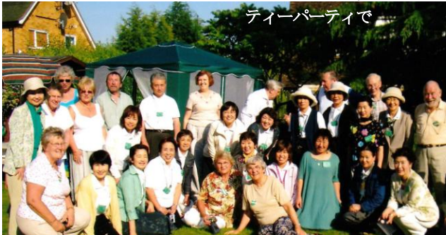
ティーパーティで

一週目のハートフォードシャーではお天気に恵まれました。ロンドンに近いクラブでしたが、会員が広範囲に在住しており、全員集合の行事のときは片道2時間もかかる方などがいて、とても大変そうでした。ホストされていない会員が何度かに分けて夕食に招待してくれたり、誕生日会に招待してくれたり、ポトラックの時の料理担当をしたり、会員同士が助け合っている印象を受けました。