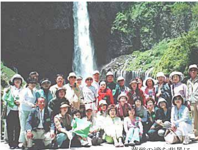
華巖の滝を背景に

今回の交換は、FF埼玉クラブではアジアの国からの初めての受け入れでした。日本に何度もいらっやられている方が多い中で、どのようにお迎えしたら喜んでいただけるのかと思ひながら、初めてのEDとして不安を抱えながらのスタートでした。