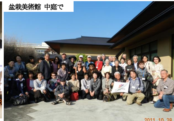
盆栽美術館 中庭で