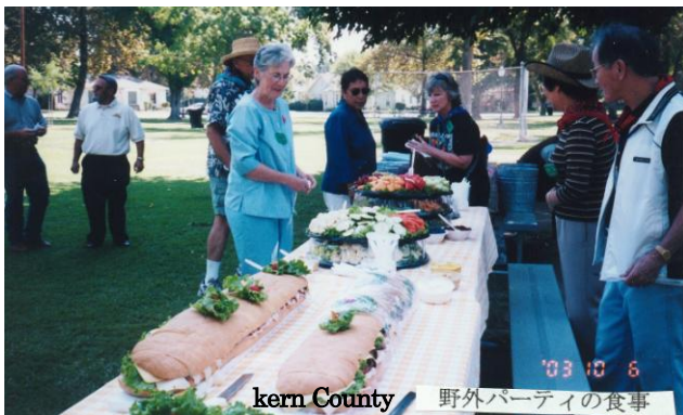
kern County 野外パーティの食事