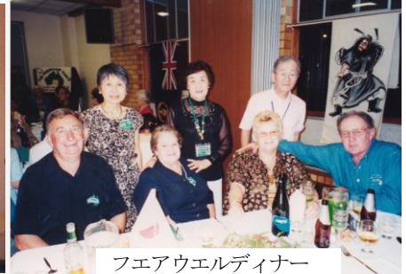
フェアウエルディナー

今回は春休みだったので、高校生、大学生も参加してもらえた意義は大きいと思います。