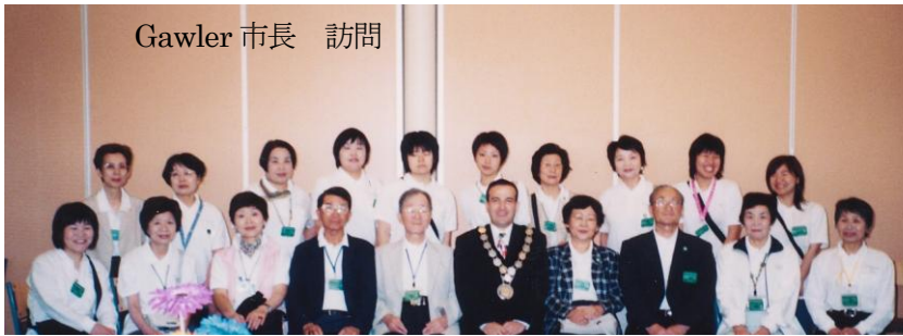
Gawler 市長 訪問