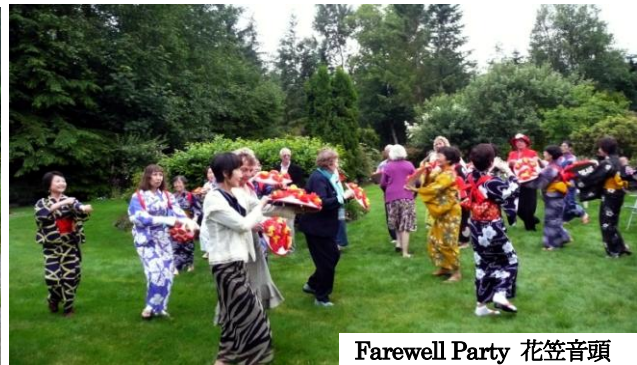
Farewell Party 花笠音頭

もっとホストとすごす時間がほしかったという感想がかなり出ました。確かにもう1日フリーデイがあればよかったなと思います。