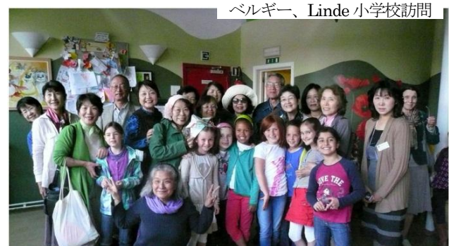
ベルギー、Linde 小学校訪問

役に取り組み、参加者全員が盛り上がり、楽しく‘JAPANESE EVENING’を過ごしました。