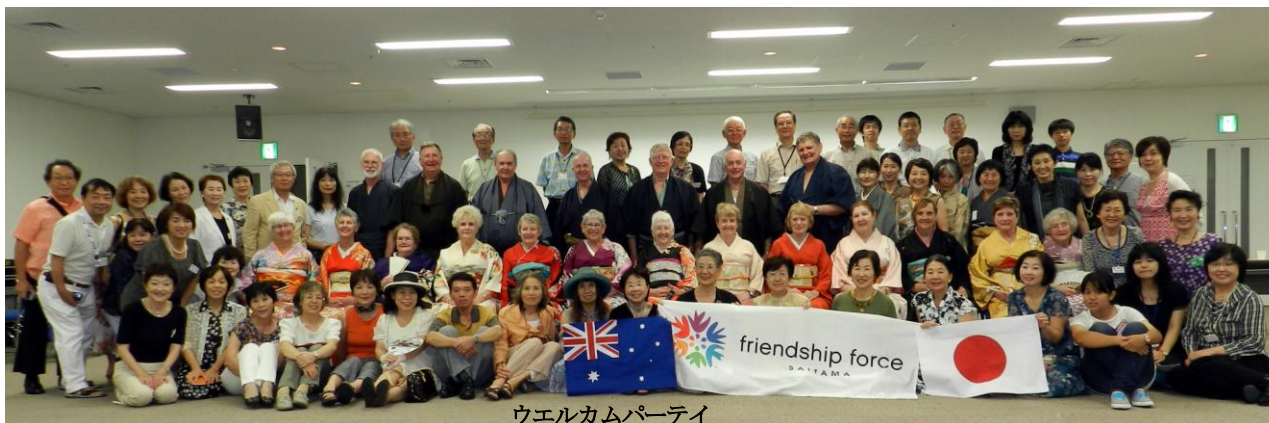
ウエルカムパーティー

南オーストラリア州のMt.バーカー&ソールズベリー2つのクラブと 9月14日から21日まで残暑の中、交換が行われました。