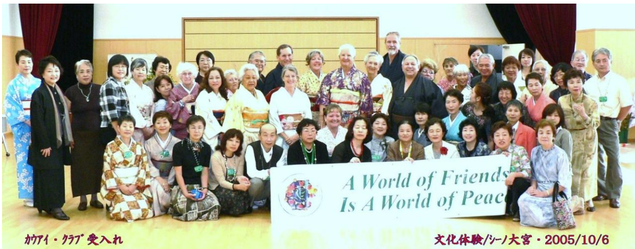
カワイ・ハワイ 受入れ