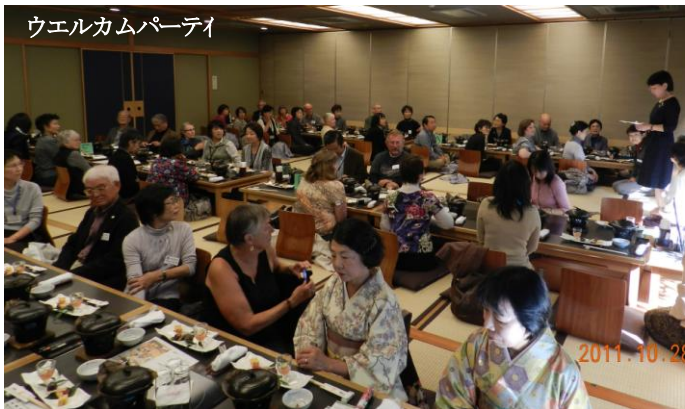
ウエルカムパーティ