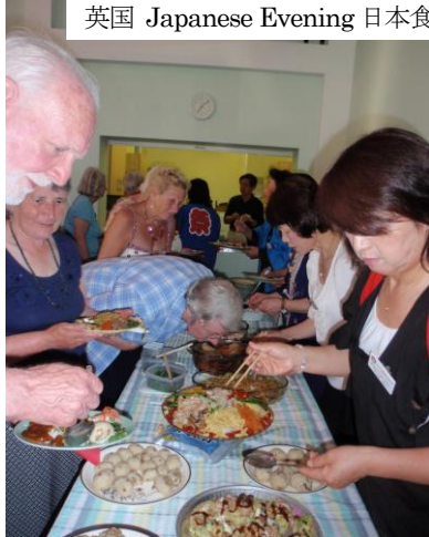
英国 Japanese Evening 日本食

3) 今回 は、なるべく新入会員に インストラクターやMC(司会)をまかせました。みんな一生懸命