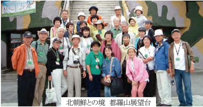
北朝鮮との境 都羅山展望台