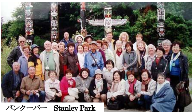
バンクーバー Stanley Park

カナダのFraser Valley との交換には、埼玉クラブから20名が参加。夫婦が4組、初めてFFの渡航に参加した人が5名でした。