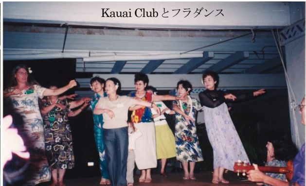
Kauai Club とフラダンス

10月4日、1週目のKern Countyへ向けてロスアンゼルスに到着したものの、出迎えのEDの姿が無かったが何とか先方に連絡がとれ、JALのターミナルで待っている事が判り 出会うことが出来ました。