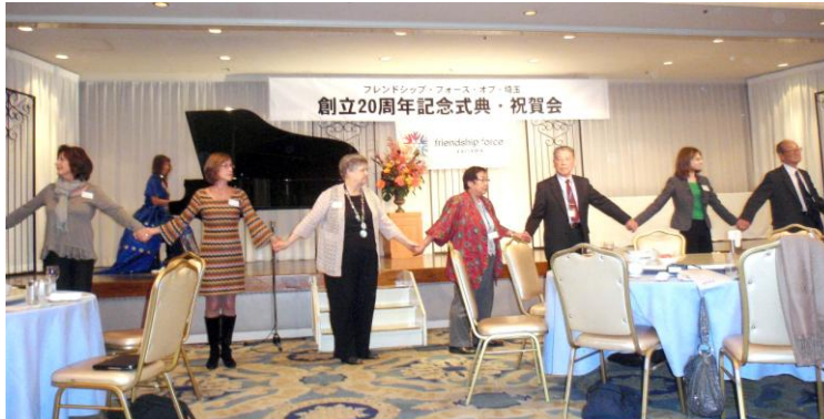
Folk Dance ジェンカで結ぶ絆