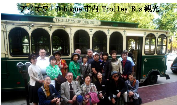
アイオワ Dubuque 市内 Trolley Bus 観光