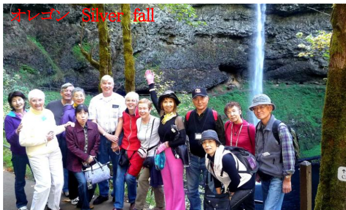
オレゴン Silver fall

オレゴンでは初めての一人のステイでとても緊張しましたが、おかげで暖かい交流ができました。