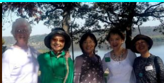
アイオワ ダンスの後の盛り上がり