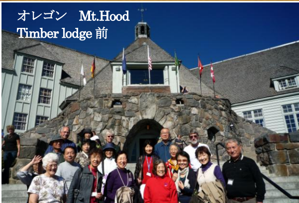
オレゴン Mt.Hood Timber lodge 前