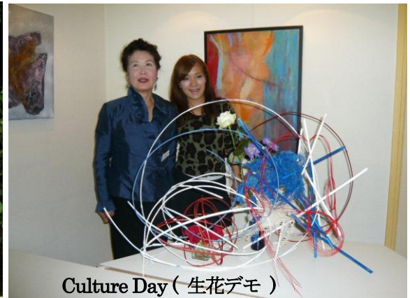
Culture Day (生花デモ)

オクラホマクラブのオランダ渡航に埼玉クラブから9名が参加。オランダとアメリカと日本の3カ国交流という大変貴重な経験ができました。