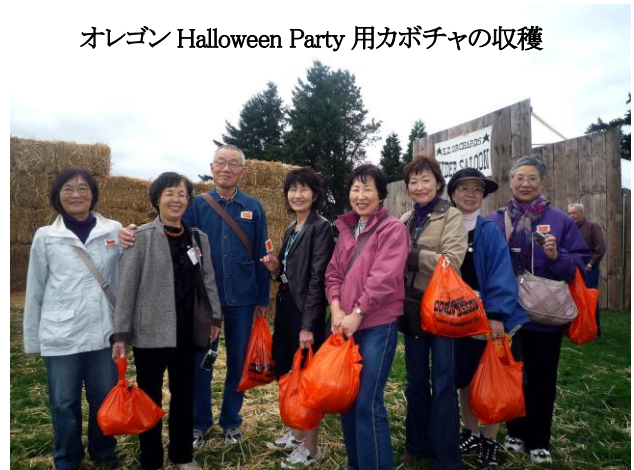
オレゴン Halloween Party 用カボチャの収穫