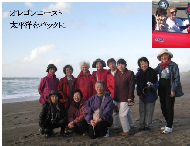
オレゴンコースト 太平洋をバックに