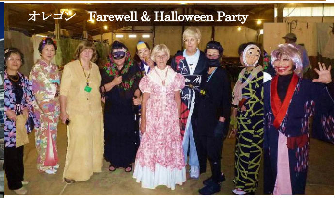
オレゴン Farewell & Halloween Party