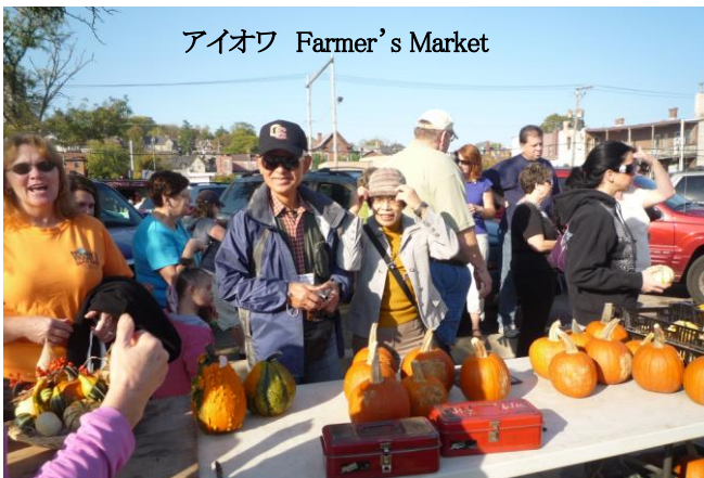
アイオワ Farmer's Market

とにかく世界大会をはじめ、毎日、会う人々のフレンドリーさとホスピタリティを実感したり、感激したりした渡航でした。ありがとうございました。