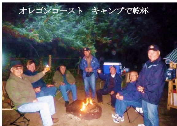
オレゴンコースト キャンプで乾杯