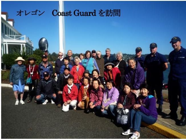
オレゴン Coast Guard を訪問