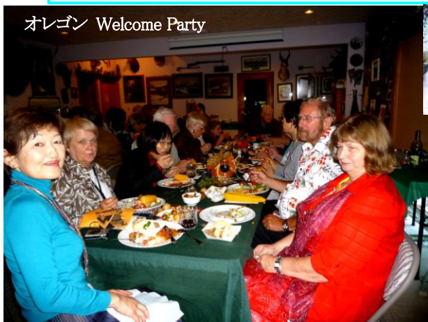
オレゴン Welcome Party