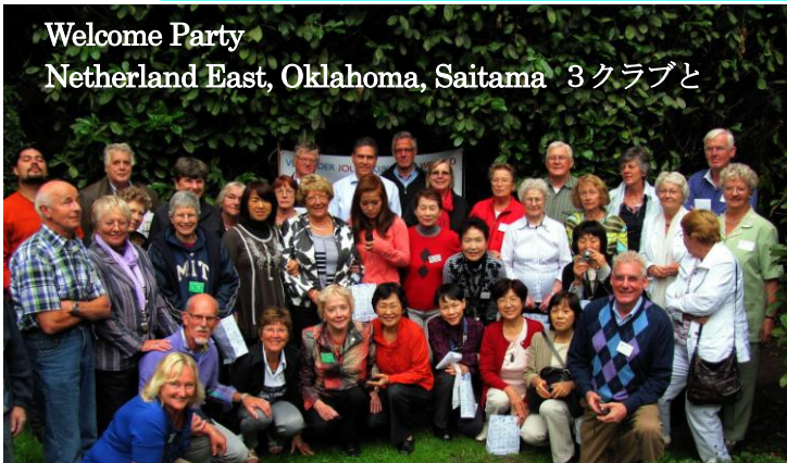
Welcome Party Netherland East, Oklahoma, Saitama 3クラブと