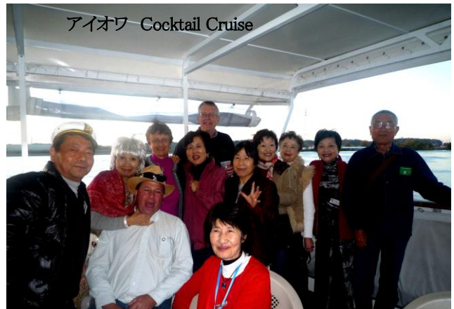
アイオワ Cocktail Cruise