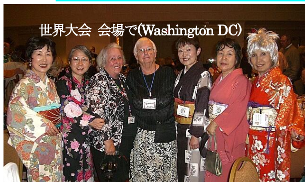
世界大会 会場で(Washington DC)