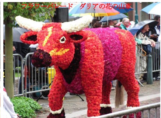
フラワーパレード ダリアの花の山車