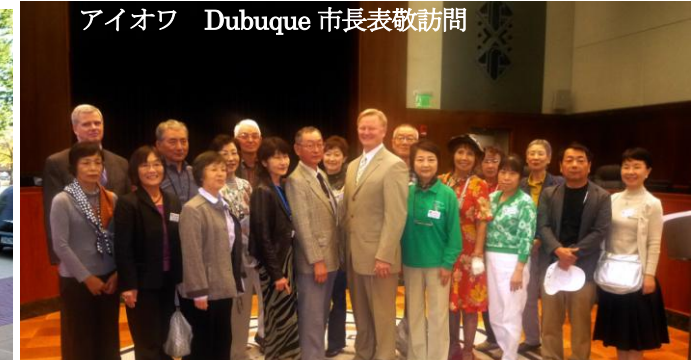
アイオワ Dubuque 市長表敬訪問