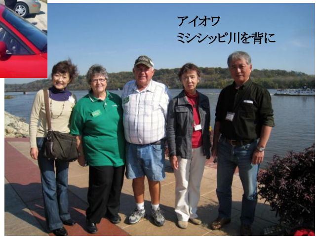
アイオワ ミシシッピ川を背に

わずかな緊張もホストにお会いしたとたん吹き飛んでしまい、天候にも恵まれ、素晴らしいステイになりました。