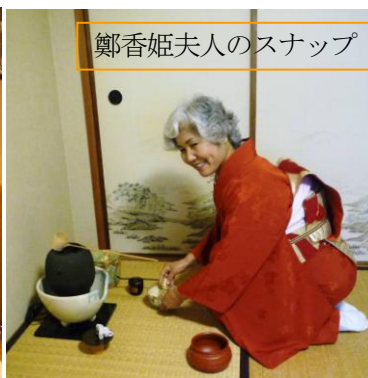
鄭香姫夫人のスナップ