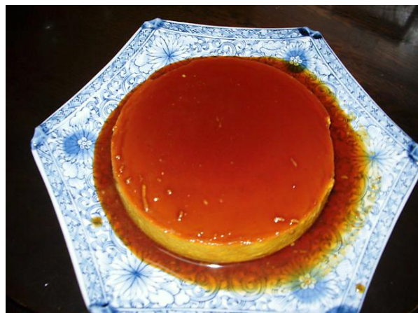
おいしい かぼちゃプリンの完成