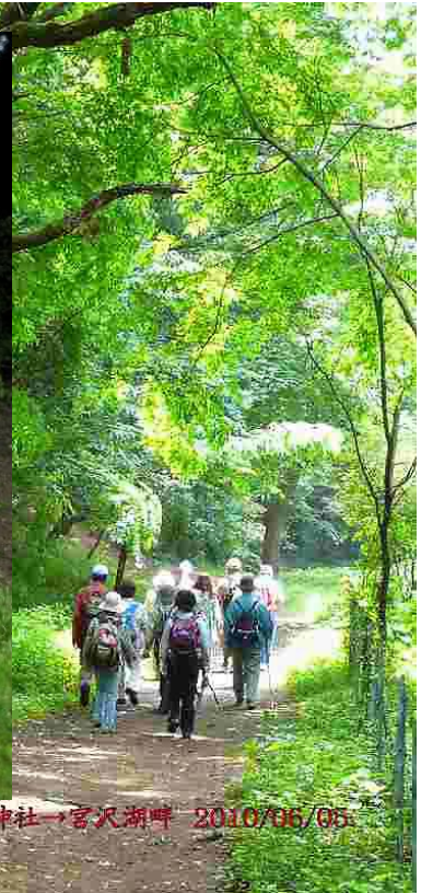
新緑の里山を歩く、加治神社→宮沢湖畔 2010/06/05