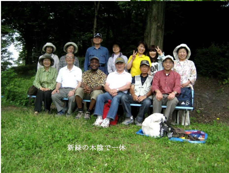
新緑の木陰で一休