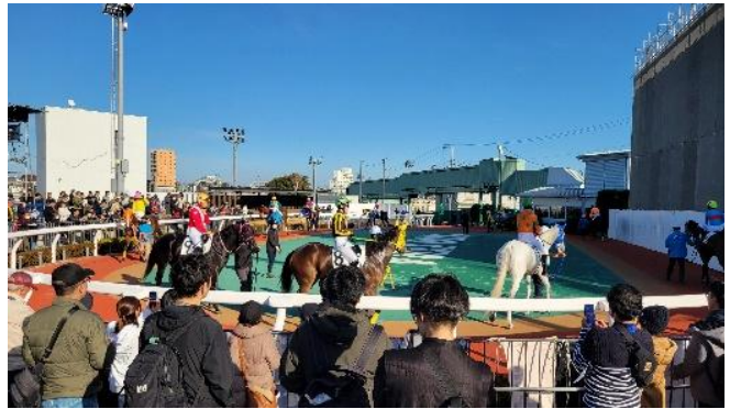
どの馬に賭けようか(パドックで)