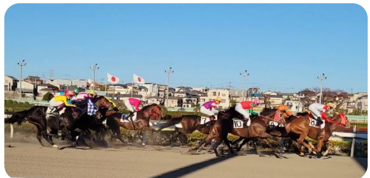
目の前を馬が駆け抜ける