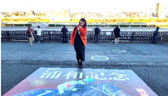
浦和記念の文字が